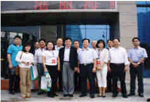
ツアーに参加者(江陰市にて)