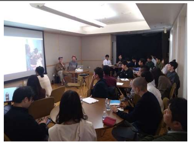
Day5 UI/UX Developer/Jordan