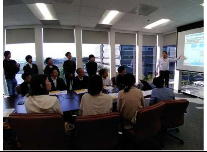
Day4 @FUJITSU GLOVIA, INC. 2