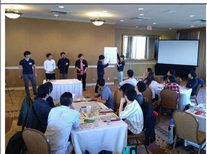
Day3 英語グループレッスンの様子 1