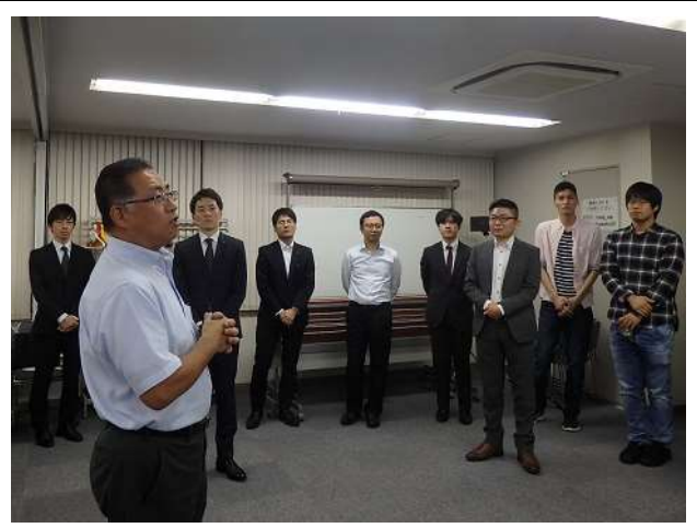
小瀬委員による中締め