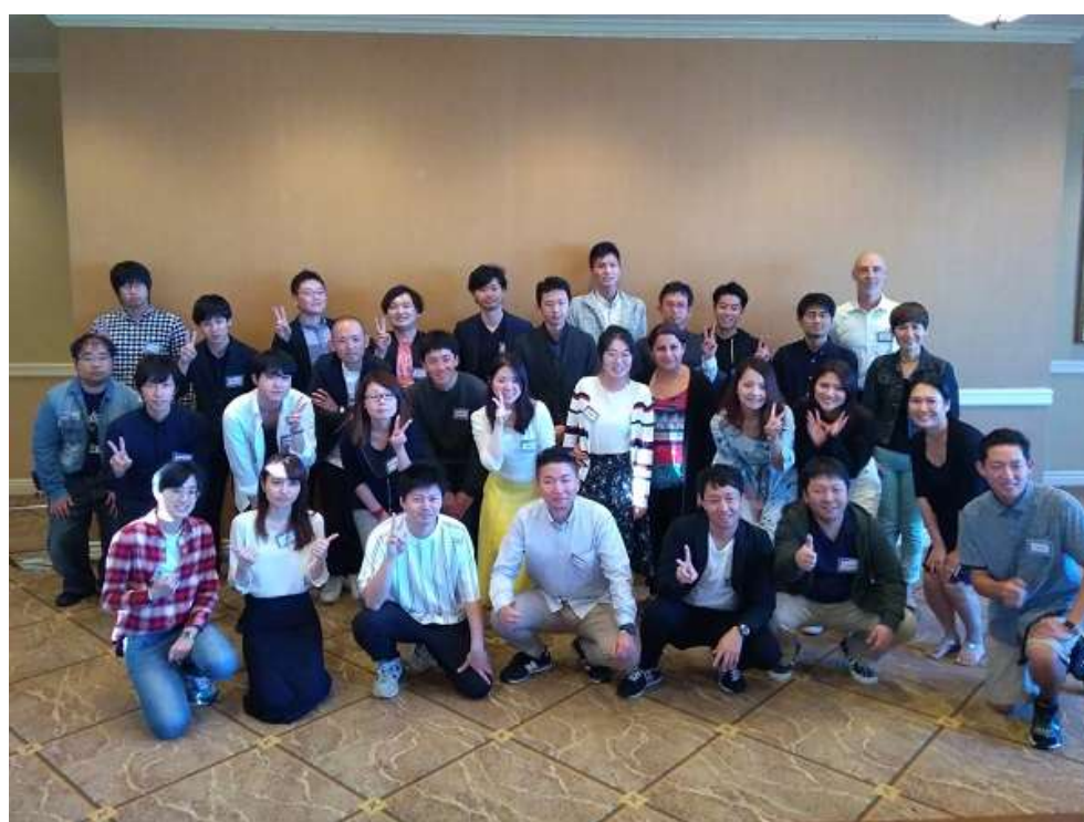
Day3 英語講師と受講生の集合写真