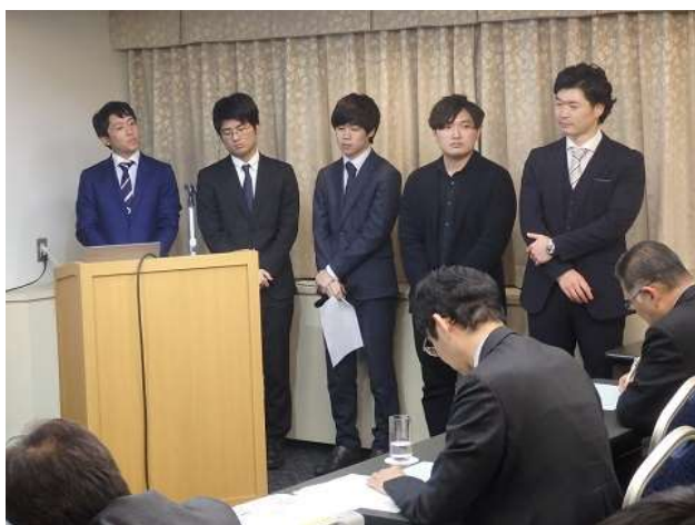
プレゼンテーションの様子