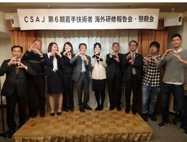
技術委員と優勝チームで記念撮影