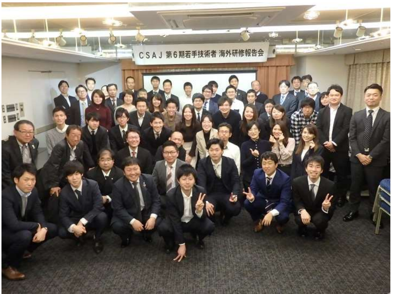
委員・上席・研修受講者全員で記念撮影