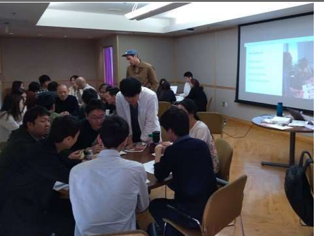
Day5 アジャイル開発の体験 2