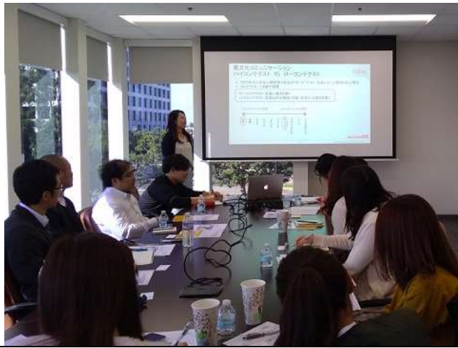
Day4 @FUJITSU GLOVIA, INC. 1