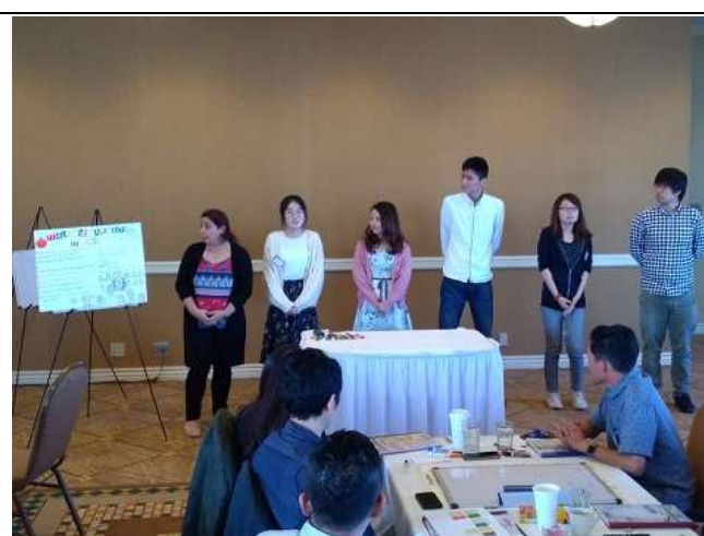
Day3 英語グループレッスンの様子 2