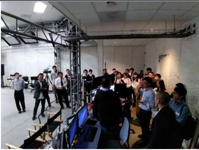
Day4 @Sony Interactive Entertainment.