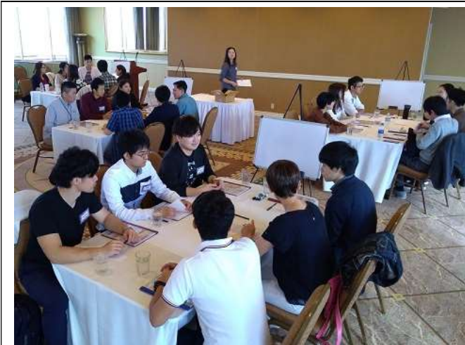
Day2 英語グループレッスン