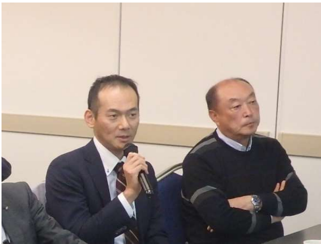
プレゼン後、上席からのアドバイス