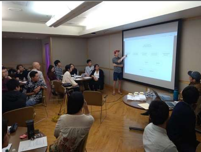
Day5 アジャイル開発の体験 1