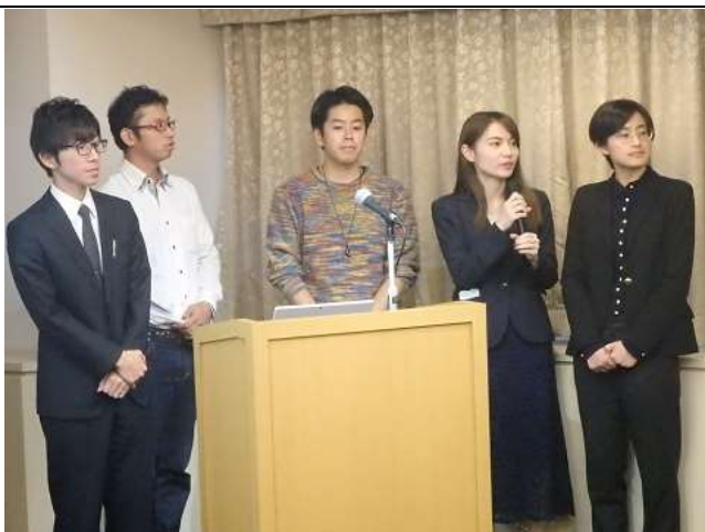
プレゼンテーションの様子