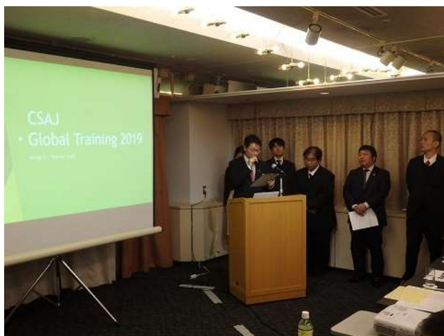
プレゼンテーションの様子