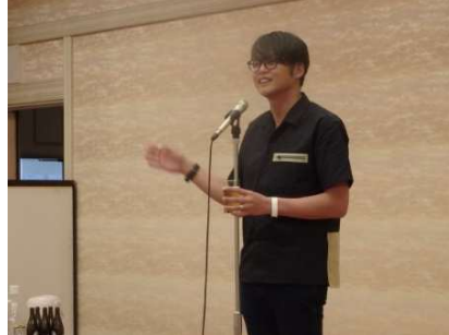
<田中会長よりご挨拶>