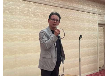
<中締め：杉本副会長>