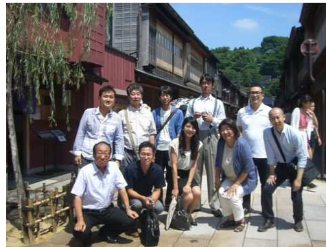
ひがし茶屋街 風情ある街並みとともに