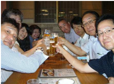
近江町市場 この後 美味しい海鮮を