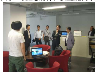
学生の研究課題をヒアリング テーマはセキュリティ