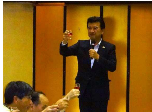
野々市市長乾杯ご発声