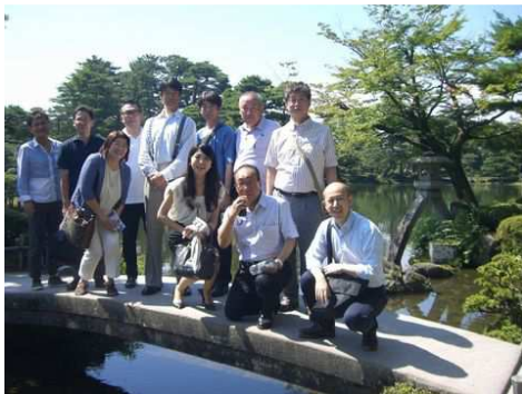
兼六園 美しい緑の中で

株式会社豆蔵ホールディングス、株式会社ミクロスソフトウェア、JBアドバンスト・テクノロジー株式会社、株式会社eBookCloud、オデッセイヒューマンシステム株式会社、株式会社建設ドットウェブ、日本事務器株式会社、株式会社ピーエスシー、Y'sラーニング株式会社、一般社団法人コンピュータソフトウェア協会