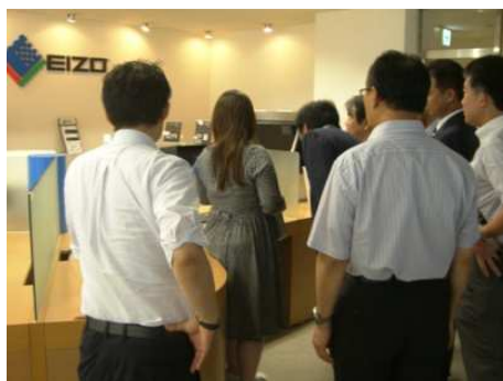
各種モニターの特徴を説明