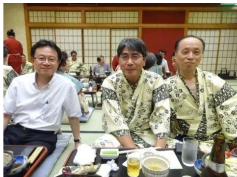
交流委員長、ISA横川専務、水谷筆頭副会長