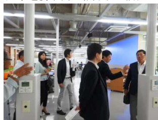
多目的フリースペース スクリーンがありプレゼンも可能