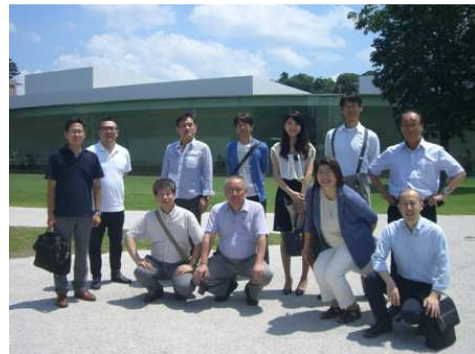
金沢21世紀美術館 芸術に囲まれて