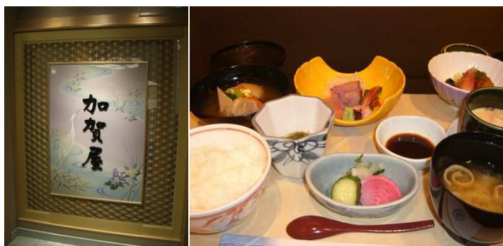
金沢の郷土料理の治部煮に舌鼓

CSAJエグゼクティブセミナーの開始は、百年の歴史を持つ旅館「加賀屋」の金沢店にてご当地名産の治部煮などをいただきました。