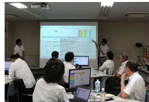
iCD活用ワークショップ