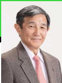
和歌山県知事 仁坂 吉伸

1974年東京大学経済学部卒業。同年4月に通商産業省に入省。大臣官房審議官（通商政策局担当）、製造産業局次長等を歴任。2003年7月ブルネイ国大使に就任。2006年12月に和歌山県知事に就任、2020年12月に関西広域連合長に就任、現在に至る。