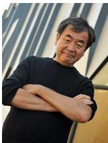
建築家 東京大学 特別教授・名誉教授 隈 研吾

1974年東京大学経済学部卒業。同年4月に通商産業省に入省。大臣官房審議官（通商政策局担当）、製造産業局次長等を歴任。2003年7月ブルネイ国大使に就任。2006年12月に和歌山県知事に就任、2020年12月に関西広域連合長に就任、現在に至る。